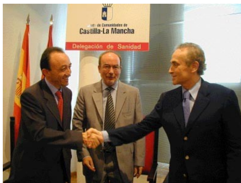
En la foto: Firma del convenio con la Consejería de Sanidad de Castilla La Mancha

También se fomentará la donación voluntaria de médula ósea y las muestras de sangre recogidas se tipificarán en los laboratorios de histocompatibilidad de la Comunidad correspondiente. Las Consejerías de Sanidad colaborarán activamente en esta gestión, en el financiamiento de las tipificaciones, en la extracción de médula ósea para su transplante y en el estricto mantenimiento de anonimato de los donantes.