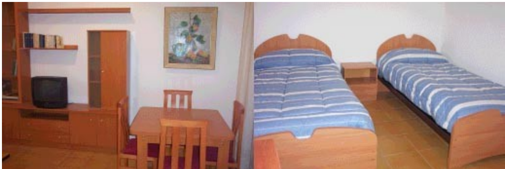
En la imágenes diversos espacios de un piso de acogida.

Por este motivo recientemente, la Fundación ha adquirido y adecuado para este servicio 4 nuevos pisos de acogida cerca de los principales centros de transplante de Barcelona: Hospital de Sant Pau; Hospital Valle de Hebrón; Hospital de Bellvitge y el Hospital Germans Trias i Pujol, este último de Badalona.