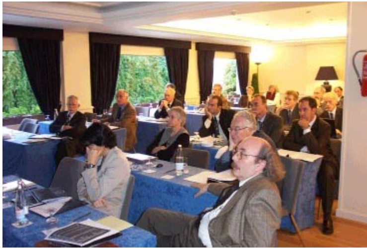
En la foto: Simposium de sangre de cordón umbilical en Barcelona organizado por la Fundación