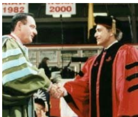
En la foto: José Carreras recibe el Doctorado Honoris Causa de las Artes de la Universidad Rutgers

Rutgers, la veterana Universidad Estatal de Nueva Jersey, fue creada en el año 1766 y se ha convertido en una de las universidades públicas con unos 50.000 alumnos en sus tres "campus".