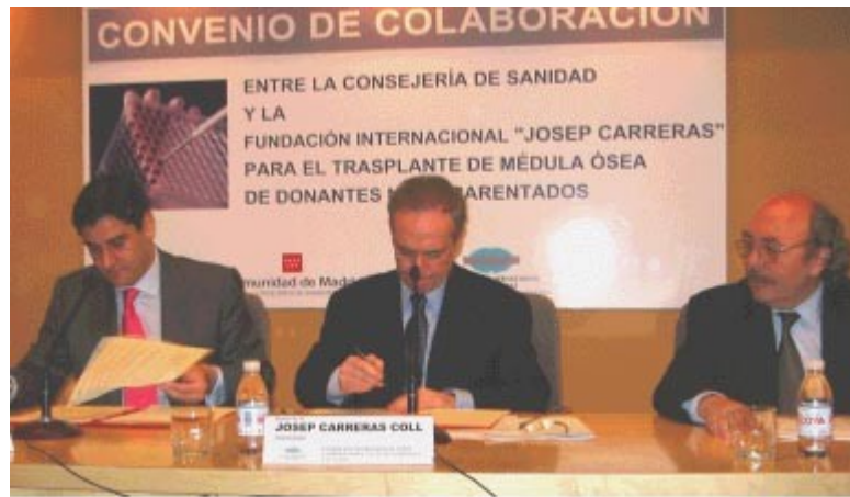
En la foto: Firma del convenio con la Consejería de Sanidad de Madrid