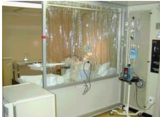
En la foto: Unidad de Transplante en el Hospital Clínico de Barcelona financiada por la Fundación.

los restantes elementos de la sangre que son devueltos al donante mediante la vena del otro antebrazo. El procedimiento dura unas 3-4 horas, no requiere ingreso hospitalario y no comporta efectos secundarios destacables. Gracias a este método una serie de donantes potenciales que no podían serlo por presentar algún riesgo anestésico se podrán incorporar a la amplia familia de donantes voluntarios.