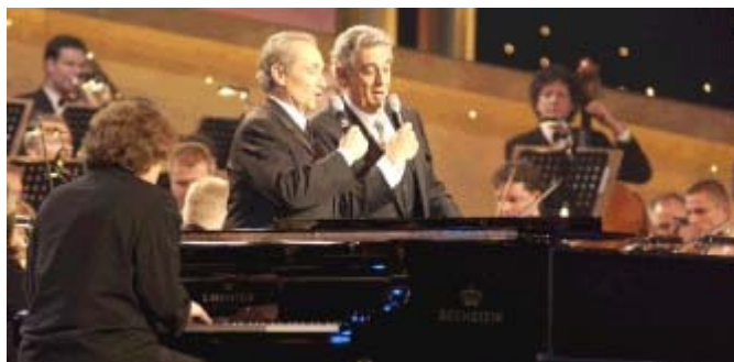
En la foto: José Carreras y Plácido Domingo en la Gala del pasado 19 de diciembre

Más tarde, el primer canal de televisión pública alemana ARD ofreció la oportunidad a la Fundación de celebrar una maratón anual en beneficio de la lucha contra la leucemia. Desde diciembre de 1995 y hasta la fecha se han celebrado ya 8 ediciones de esta importante Gala con unos extraordinarios resultados económicos, de proyección y de sensibilización social. La última gala tuvo lugar el 19 de diciembre de 2002 con un extraordinario éxito sin precedentes.