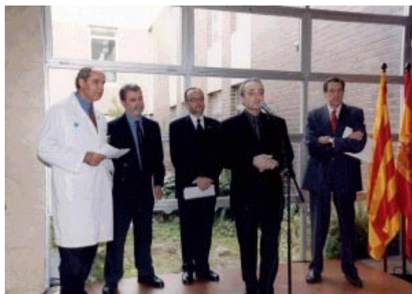
En la foto: Inauguración de la Unidad Hemato-oncológica José Carreras en el Hospital Germans Trias i Pujol.

La Fundación ha financiado proyectos en este sentido en el Hospital del Mar, en el Hospital Clínico, en el Hospital Durán y Reynals, en el Hospital Universitari Germans Trias y Pujol, La Fundación de Búsqueda Biomédica del Hospital Valle de Hebrón, etc.