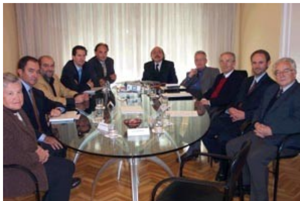
En la foto: Reunión de la Comisión Científica Nacional el 22 de noviembre de 2002