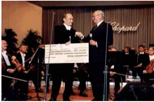
En la foto: recital benéfico de Chopard, ejemplo de solidaridad empresarial